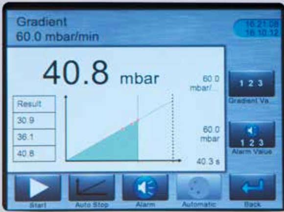
Touchscreen für die Bedienung des Instruments