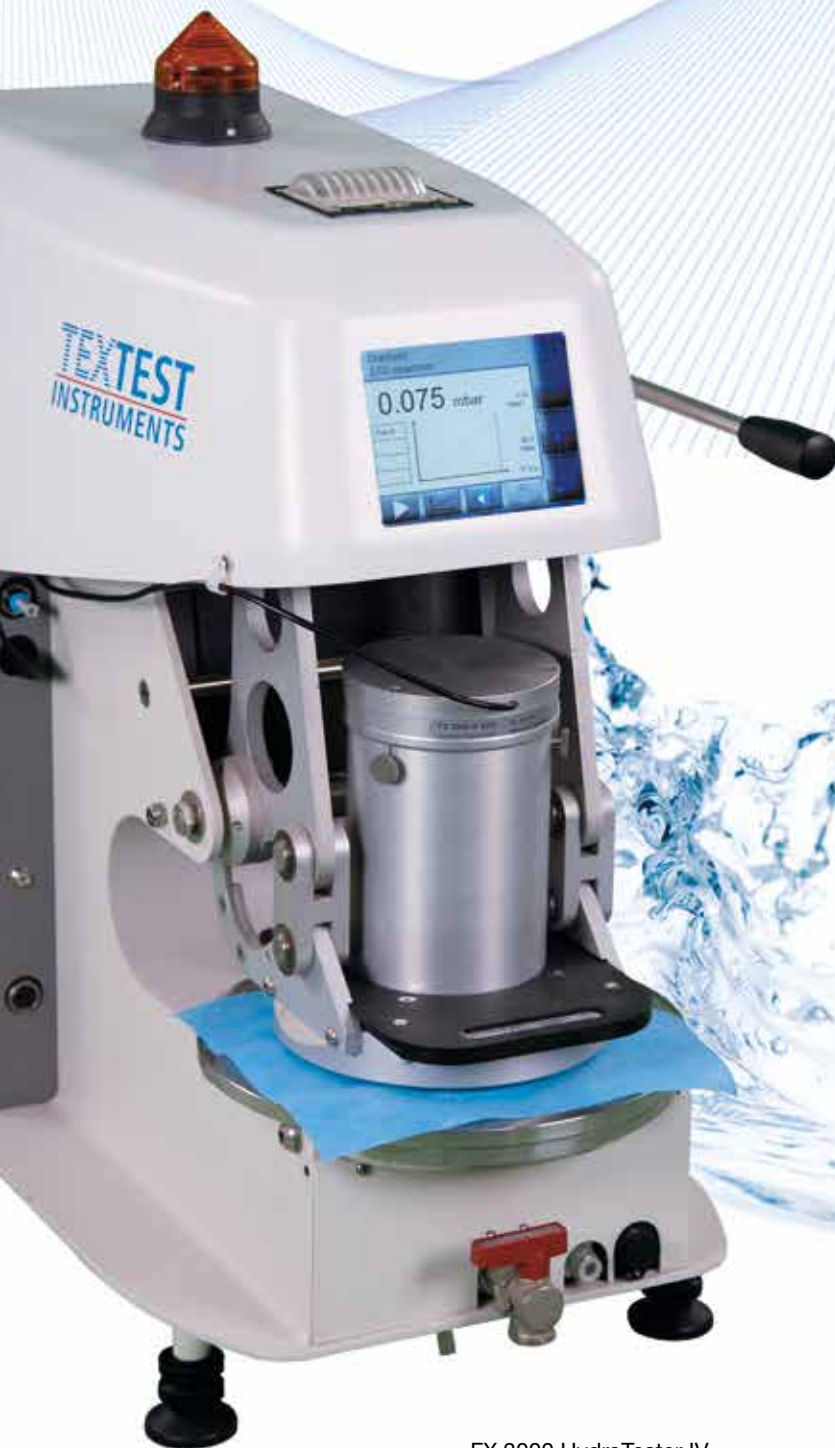
FX 3000 HydroTester IV mit Automatischem Tropfendetektor

Die vierte Generation des Wasserdichtheits-Prüfgerätes besticht durch seine Flexibilität, seine Benutzerfreundlichkeit und seinen grossen Messbereich. Das Instrument arbeitet nach AATCC 127, ASTM F 1670, BS 2823, DIN 53886, EN 1734, EN 20811, FZ/T 01004, GB/T 4744, GB 19082, ISO 811, JIS L 1092 A, JIS L 1092 B-a+b, WSP 80.6 und vielen anderen nationalen und internationalen Normen.