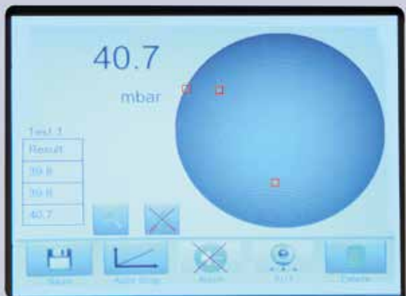
Auf Touchscreen projiziertes Bild vom Automatischen Tropfendetektor

Das Instrument kann via Kabel oder WLAN an einem Netzwerk angeschlossen werden. Mit dem optionalen Auswertemodul können Prüfprotokolle im PDF- oder XML-Format vom Webserver des Instruments heruntergeladen werden. Alternativ dazu ist ein integrierter Streifendrucker verfügbar.